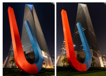
(熄灯前后的上海环球金融中心)