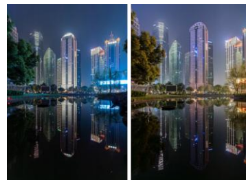
(熄灯前后的恒生银行大厦)